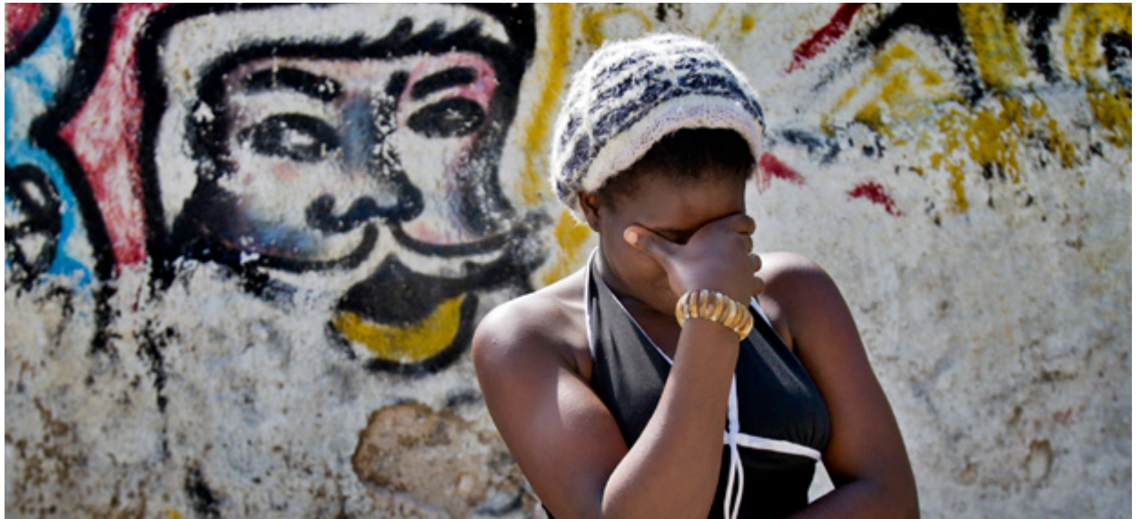
Weltweit leiden Frauen und Mädchen unter den physischen und psychischen Folgen unsachgemäßer Schwangerschaftsabbrüche.

Laut der Weltgesundheitsorganisation (WHO) werden jedes Jahr rund 22 Millionen unsachgemäße Schwangerschaftsabbrüche vorgenommen. Das bedeutet, dass sie von Personen vorgenommen werden, die nicht über die erforderlichen Fähigkeiten verfügen, oder dass sie in einem Umfeld stattfinden, das nicht den medizinischen Mindeststandards entspricht. Es wird geschätzt, dass jährlich 47.000 Frauen und Mädchen bei diesen Abbrüchen sterben, und weitere fünf Millionen unter den physischen Folgen leiden. Das tatsächliche Ausmaß ist unbekannt – denn viele Frauen und Mädchen haben keinerlei Möglichkeit, medizinische Hilfe in Anspruch zu nehmen, und niemand weiß, wie viele wirklich daran sterben.